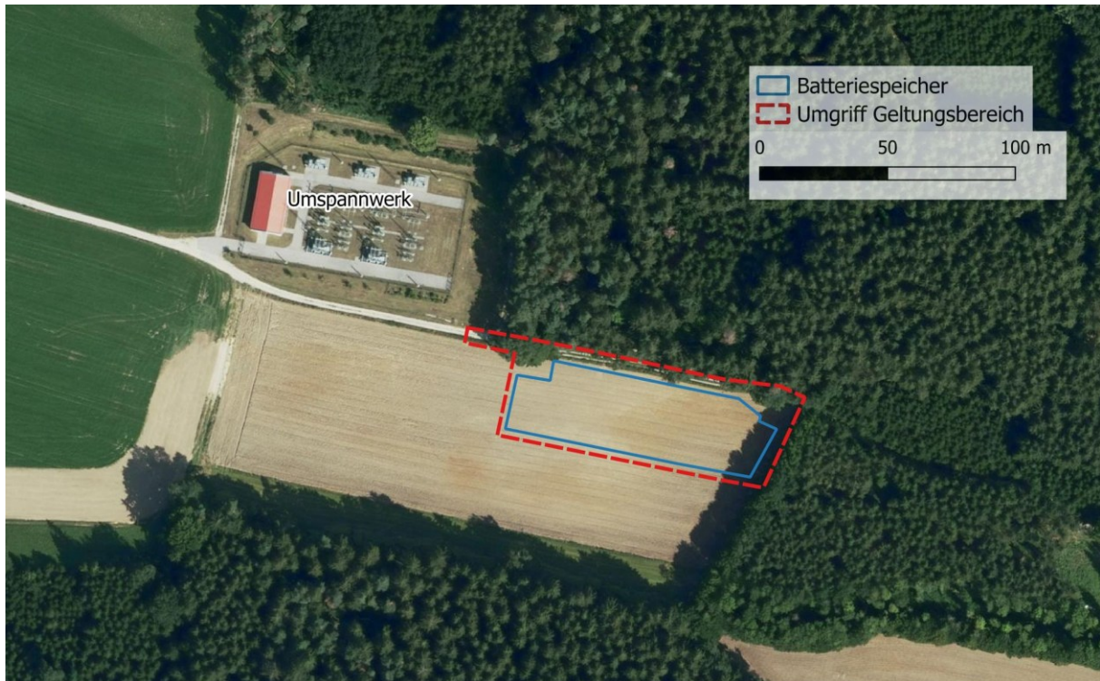
Karte 2: Geplante Fläche für den Batteriespeicherpark und vorhandenes Umspannwerk Kleinschwabhausen (Geobasisdaten: Bayerische Vermessungsverwaltung)